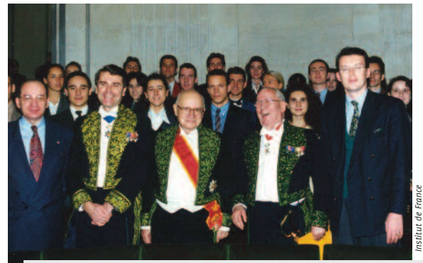
Les étudiants sous la Coupole de l'Académie française (1994)