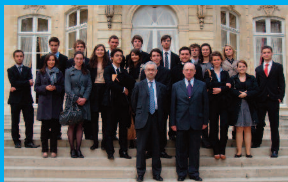
Les étudiants sur le perron de l'Hôtel de Matignon (2010)

La direction et les enseignements sont assurés à titre entièrement bénévole et l'Institut fonctionne en totale autonomie financière grâce uniquement aux droits d'entrée acquittés par ses étudiants.