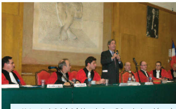
M. Jean-Louis Debré, Président du Conseil Constitutionnel (2009)