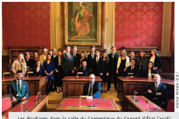
Les étudiants dans la salle du Contentieux du Conseil d'État (2018)

Jean-Etienne-Marie PORTALIS, Discours du 26 novembre 1803 à l'Académie de Législation