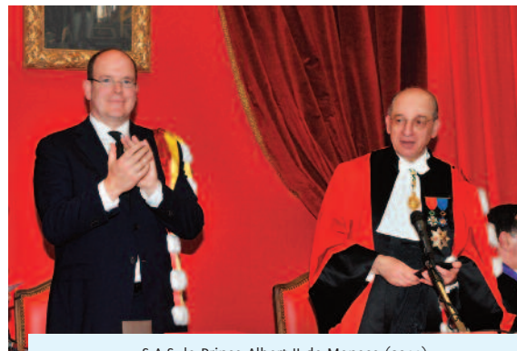
S.A.S. le Prince Albert II de Monaco (2011)

Par la suite, nos diplômés font de très honorables carrières dans la haute Administration (Conseil d'État, cabinets ministériels), le secteur privé ou libéral (notamment le barreau), et la plupart attestent que la formation générale reçue à l'Institut leur a été très utile tant pour leur culture personnelle que pour leur carrière professionnelle.