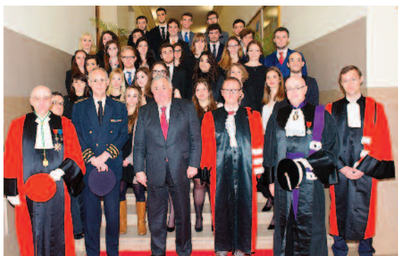
M. Gérard Larcher, Président du Sénat (Aix, 2016)

La traditionnelle séance solennelle de l'Institut Portalis est placée sous la présidence d'une personnalité nationale ou internationale qui vient à Aix pour remettre les diplômes à la nouvelle promotion et prononcer une conférence devant la communauté universitaire. Ont été reçus ces dernières années : les Académiciens Jérôme Lejeune, Pierre Chauvu, Jean Foyer et Pierre Delvolvé, ainsi que MM. Maurice Couve de Murville, Ancien Premier Ministre, Pierre Draï, Vincent Lamanda et Bertrand Louvel, Premiers Présidents de la Cour de cassation, Pierre Mazeaud, Président de la Commission des Lois à l'Assemblée nationale, Christian Poncelet et Gérard Larcher, Présidents du Sénat, Marceau Long et Jean Marc Sauvé, Vice-Présidents du Conseil d'État, Jean-Louis Debré, Président du Conseil constitutionnel, Patrick Gérard, Directeur de l'ENA, François Molins, Procureur général près la Cour de cassation et S.A.S le Prince Albert II de Monaco.